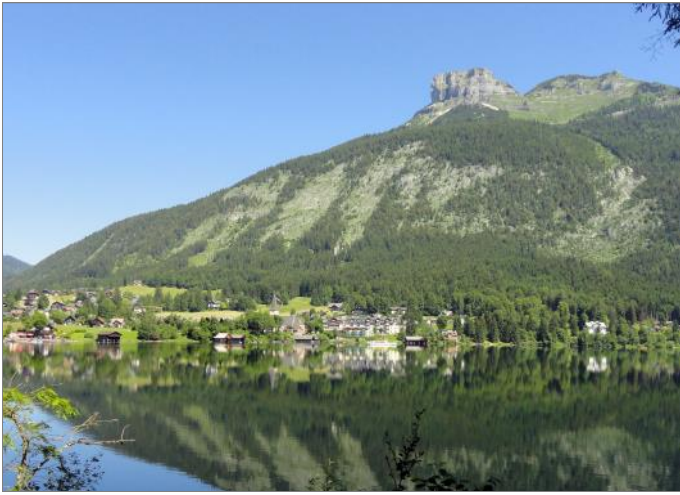
Glasklar liegt er vor uns, der Altausseer See am Fuße des Losers, umgeben von Wald und Bergen. Ein Naturjuwel auf 712 m Seehöhe, 2,1 km 2 groß und bis zu 53 m tief.