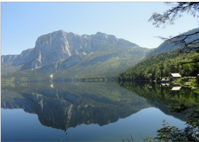
Der Weg steigt nun kurz leicht an und führt uns am Seeufer entlang. Nach kurzer Zeit tauchen wir ein in die schattige Welt des Waldes. Immer wieder eröffnen sich uns schöne Ausblicke zum Fotografieren und Verweilen. Nach 1,5 Kilometern am Schotterweg, sehen wir einen Bachlauf mit einem kleinen Wasserrad. Wenige Minuten